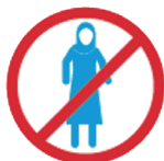
BURKINI MAILLOT INTEGRAL