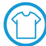
T-SHIRTS LYCRA MANCHES COURTES