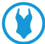
MAILLOTS 1 OU 2 PIÈCES