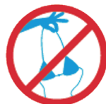
TOPLESS ET STRINGS