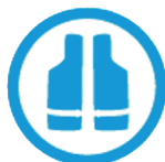
GILLETS ET BOUÉES ENFANTS