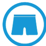
SHORTS OU SLIPS DE BAIN