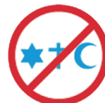
SIGNES RELIGIEUX OBSTENTATOIRES